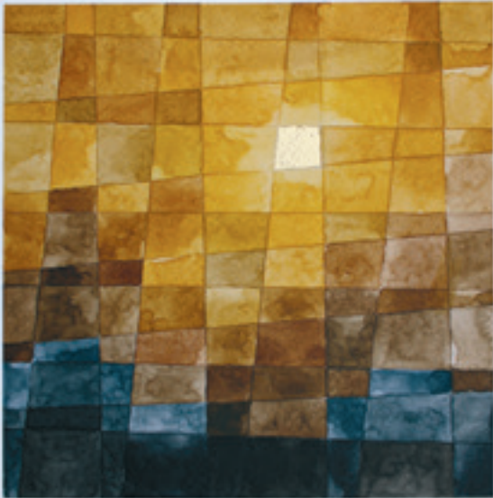
16:35, 2020, акварел, 21 x 21 см