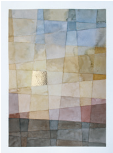
08:47, 2021, акварел, 38 x 28 цм