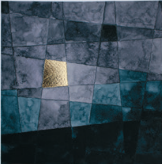
20:52, 2021, акварел, 22 x 22 см